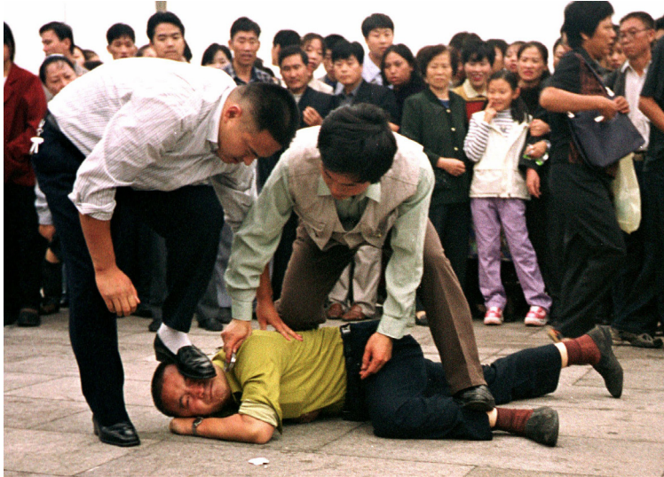
BẮT GIỮ THÔ BAO: Cảnh sát mặc thường phục hành hung một học viên Pháp Luân Công trên quảng trường Thiên An Môn

Chiến dịch đàn áp Pháp Luân Công là một “chiến dịch tuyên truyền đồ sộ” nhằm phi báng và phá hoại cảm tình của công chúng đối với môn tu luyện. Hàng triệu cuốn sách Pháp Luân Công đã bị công an tịch thu và đốt trên các quảng trường. Thêm vào đó, mọi tầng lớp của xã hội – từ công an, thẩm phán, lãnh đạo trường học và các tổ chức – đều bị buộc phải tham gia.