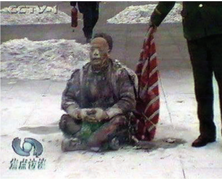
CHỜ ĐỢI TÍN HIỆU: Trong một cảnh diễn vụng về, viên cảnh sát đứng đợi bên cạnh một người được coi là học viên Pháp Luân Công đang tự thiêu. Đây chỉ là một trong số hàng chục điểm nghi vấn trong vụ lừa đảo tồi tệ này.

bố rằng thước phim quay vụ tự thiêu được thu giữ từ các phóng viên của đài truyền hình CNN. CNN nói điều này là vô lý; các phóng viên của họ đã bị bắt ngay khi vụ tự thiêu diễn ra. Chính quyền Trung Quốc đã có mặt ở đó để quay thước phim, điều này càng đẩy lên phỏng đoán rằng vụ việc đã được dàn dựng. • Phương tiện truyền thông của chính phủ Trung Quốc được phép độc quyền phỏng vấn các nạn nhân của vụ tự thiêu. Truyền thông nước ngoài và các nhà nghiên cứu độc lập đều bị cấm phỏng vấn. Bản thân gia đình của các nạn nhân không được phép vào bệnh viện để thăm họ, nhưng các phóng viên của chính phủ lại được phép. Bạn muốn tìm hiểu kỹ hơn? Hãy truy cập trang web www.falsefire.com