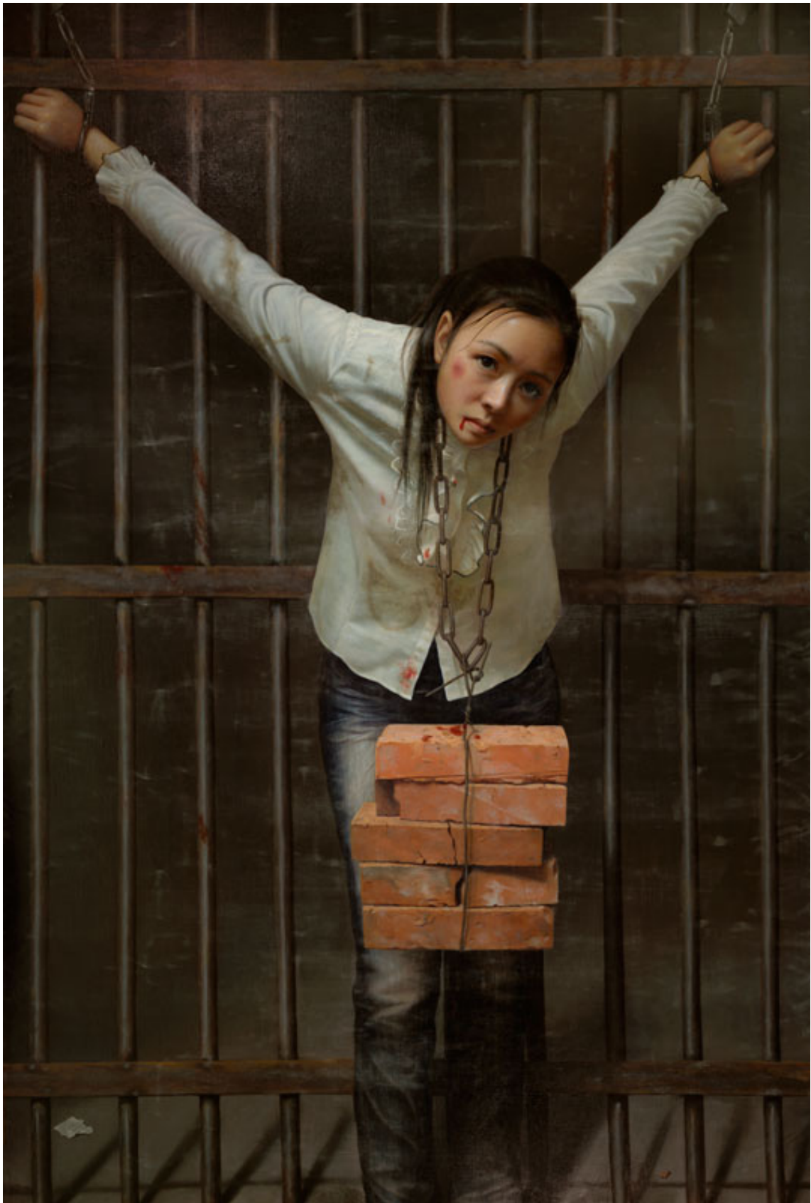
KIỆN ĐỊNH TRONG BỨC HẠI: Tác phẩm của nghệ sĩ Thanh Tâm miêu tả một trong nhiều thủ đoạn tra tấn mà ĐCSTQ đã sử dụng trong khi bức hại các học viên Pháp Luân Công.

Tân Hoa Xã, cơ quan ngôn luận chính thức của ĐCSTQ, đã phát ngôn một cách rõ ràng sự việc này sau khi chiến dịch đàn áp được phát động, rằng: “Các nguyên lý Chân, Thiện, Nhân của Pháp Luân Công không có điểm chung nào với lý tưởng đạo đức và tiến bộ văn hóa xã hội chủ nghĩa mà ĐCSTQ đang nỗ lực thực hiện.”