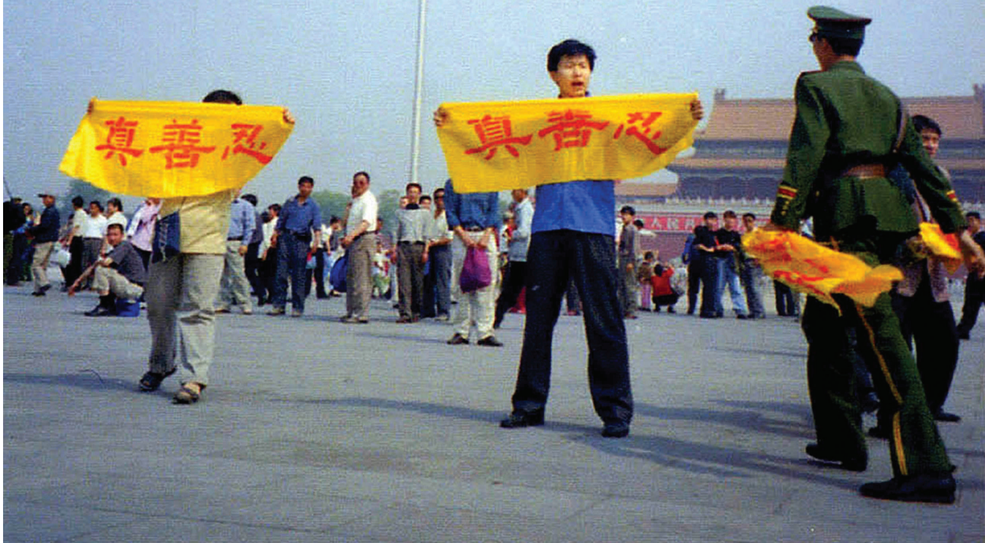
BẦY TỔ LẬP TRƯỜNG: Trên quảng trường Thiên An Môn, các học viên Pháp Luân Công giương biểu ngữ “Chân, Thiện, Nhẫn” khi cảnh sát tiến đến.