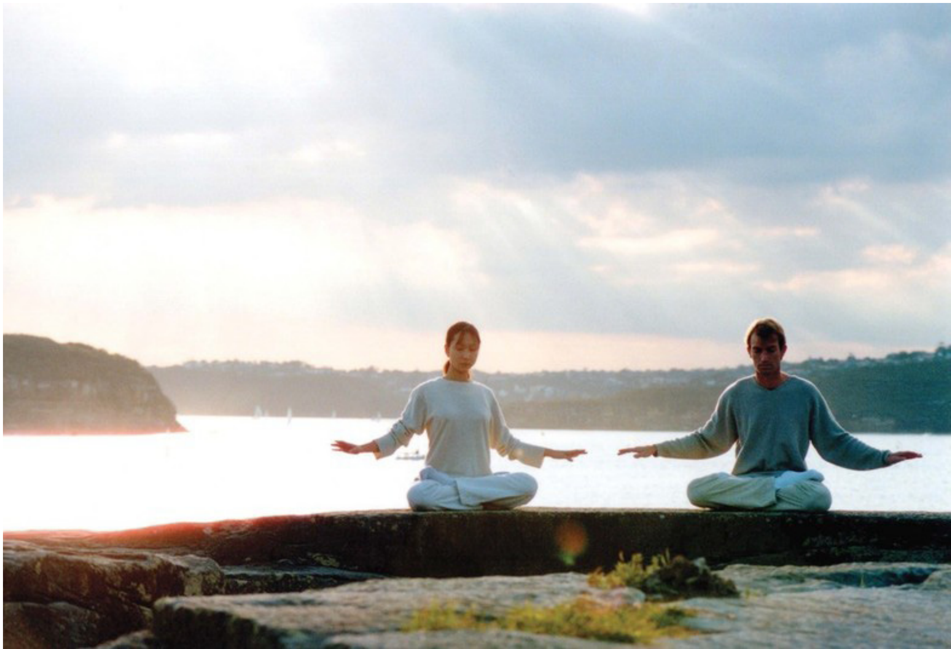
BÌNH MINH: Các điểm luyện tập Pháp Luân Công thường được thấy tại các công viên công cộng và các trung tâm cộng đồng. Các động tác uyển chuyển dễ học và luôn được dạy miễn phí của môn tập làm tăng thêm vẻ thanh bình cho khung cảnh một buổi sáng mùa hè như thế này ở Úc.