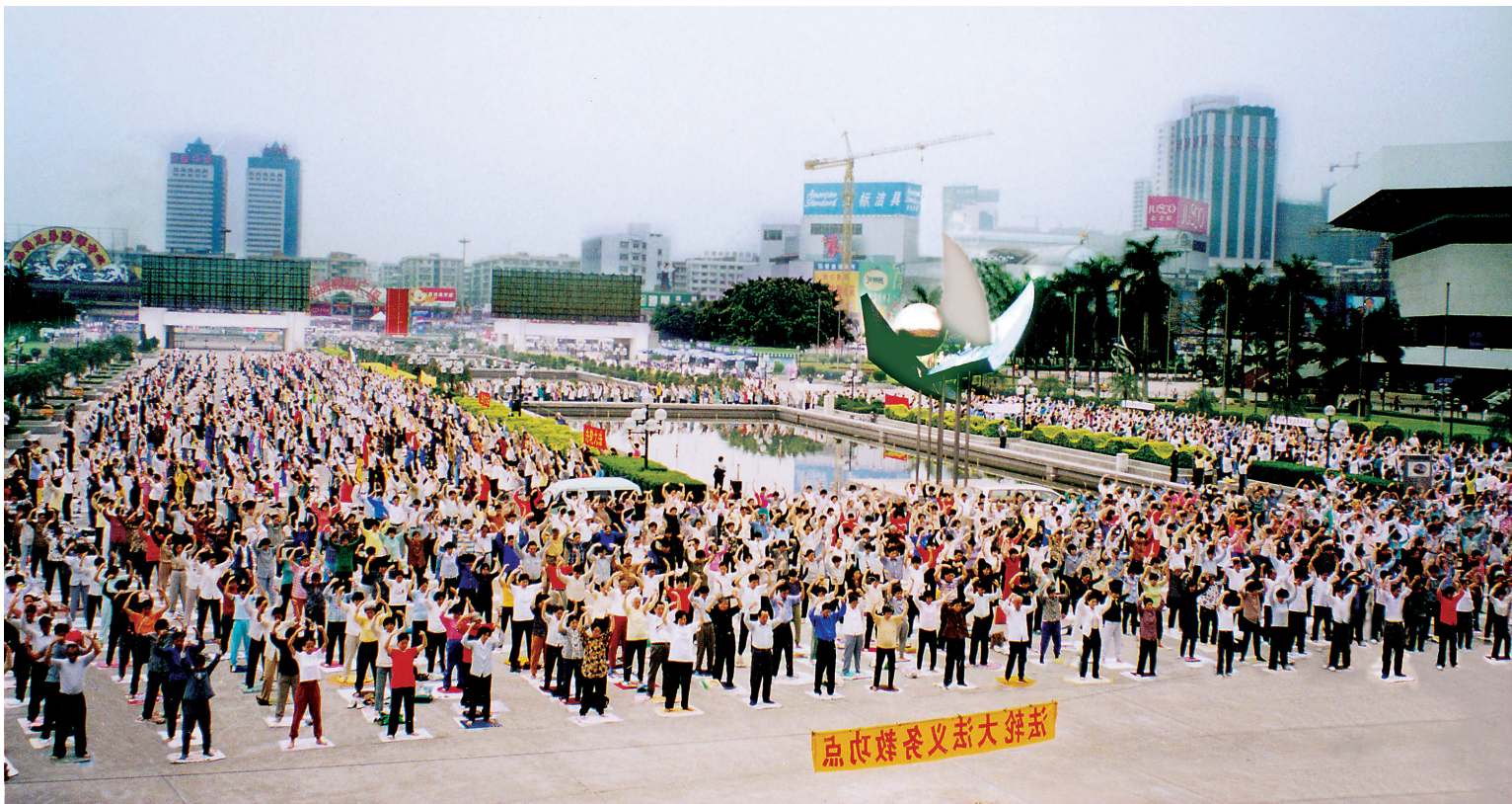
LUYỆN CÔNG BUỔI SÁNG: Vào giữa những năm 1990, các điểm luyện công của Pháp Luân Công như thế này tại Quảng Châu đã trở thành hình ảnh quen thuộc ở Trung Quốc.

Vào cuối thập niên 1990, sự phát triển phổ biến của Pháp Luân Công đã trở thành mối lo ngại của một số lãnh đạo cấp cao trong ĐCSTQ.