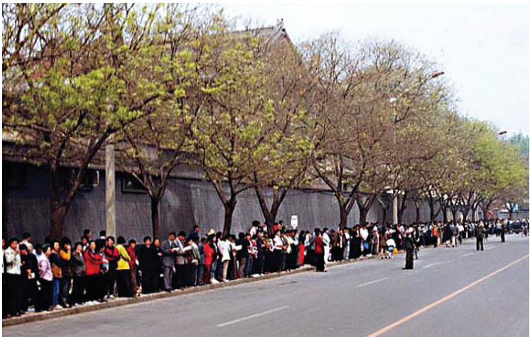
TẬP TRUNG VÌ CÔNG LÝ: các học viên Pháp Luân Công đứng trật tự tại Bắc Kinh vào ngày 25 tháng Tư năm 1999. Cuộc thỉnh nguyện ôn hòa, lịch sử nhằm phản đối sách nhiễu leo thang sau đó lại bị phương tiện truyền thông nhà nước, trong một nỗ lực để biện minh cho chiến dịch bức hại của đảng, dán nhãn là một “cuộc bao vây”