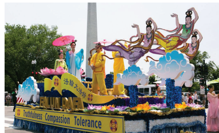
Các học viên trẻ biểu diễn các bài công pháp Pháp Luân Đại Pháp trên xe diễu hành.

Vào ngày 4 tháng 7 năm 2025, cuộc diễu hành Ngày Độc lập đã được tổ chức tại Washington D.C. để kỷ niệm quốc khánh lần thứ 249 của Hợp chúng quốc Hoa Kỳ. Hàng chục nghìn người từ khắp Hoa Kỳ và các quốc gia khác đã tập trung tại Washington D.C. để tận hưởng không khí lễ hội. Các học viên Pháp Luân Đại Pháp một lần nữa được mời tham gia cuộc diễu hành và được khán giả từ khắp nơi trên thế giới nồng nhiệt chào đón.