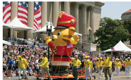
Các học viên Pháp Luân Đại Pháp được mời đẩy chiếc xe có nhân vật hoạt hình khổng lồ trong cuộc diễu hành.