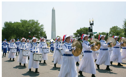
Đoàn nhạc Tian Guo tham gia cuộc diễu hành Ngày Độc lập ở Washington D.C., ngày 4 tháng 7 năm 2025.