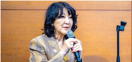
Thượng nghị sỹ Satsuki Katayama phát biểu tại hội nghị

Các nhà lập pháp Nhật Bản và Đài Loan bày tỏ sự ủng hộ