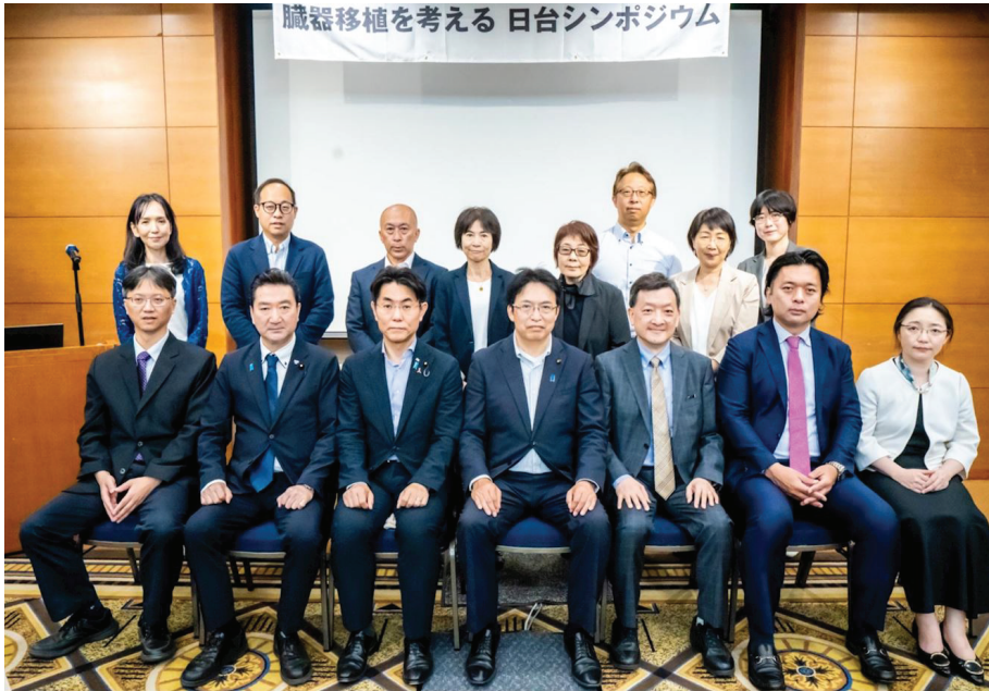
Những người tham gia Hội nghị Nhật Bản – Đài Loan về ghép tạng.

Ngày 5 tháng 6 năm 2025, Hiệp hội Nghiên cứu Cấy ghép Nội tạng Trung Quốc và Hiệp hội Chăm sóc Quốc tế về Cấy ghép Nội tạng Đài Loan đã tổ chức Hội nghị Nhật Bản – Đài Loan về Cấy ghép Nội tạng tại Khách sạn Zenkoku Choson Kaikan, Tokyo.