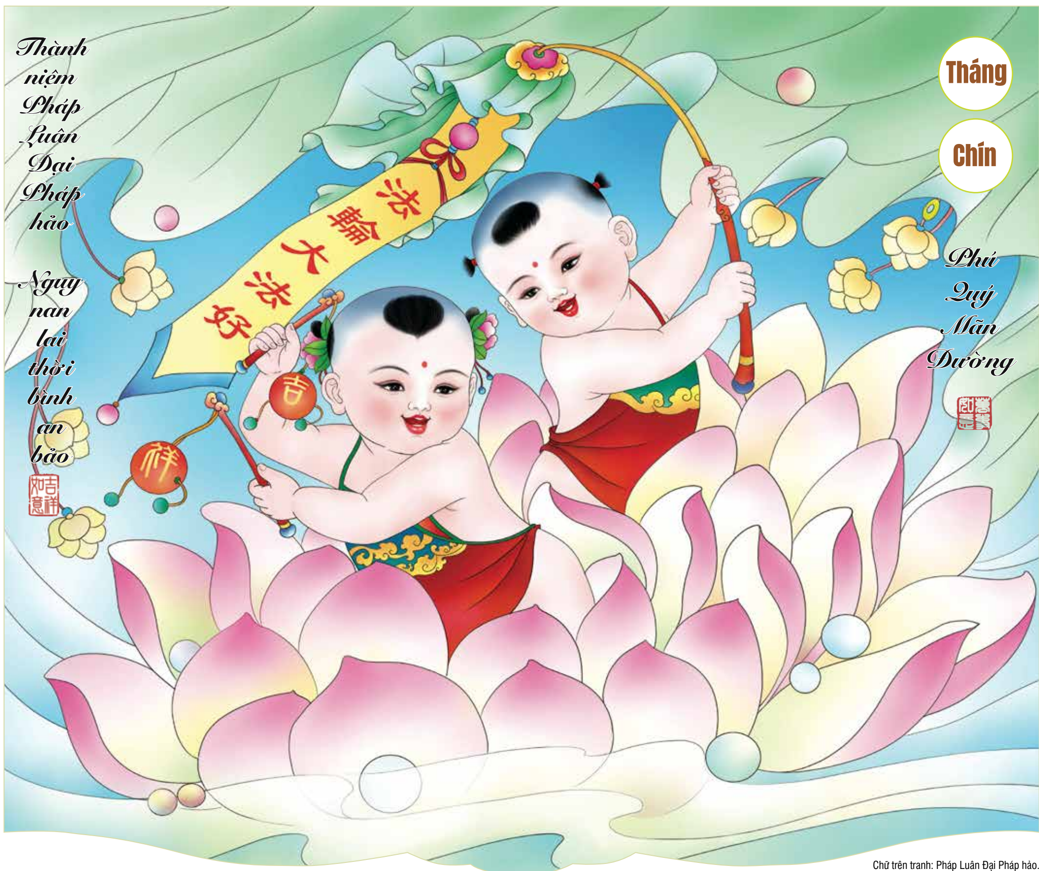
Chữ trên tranh: Pháp Luân Đại Pháp hảo.