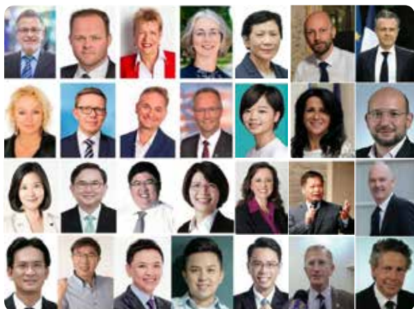
Các quan chức chính phủ, các nhà lãnh đạo, các quan chức đặc cử Pháp, Đức, Úc, Đài Loan bày tỏ ủng hộ đối với Pháp Luân Công và lên án cuộc bức hại.

Sau khi Hoa Kỳ thông qua Đạo luật Magnitsky vào năm 2016, Canada, Vương Quốc Anh, 27 quốc gia thành viên của Liên minh Châu Âu (EU), và Úc cũng đã ban hành đạo luật tương tự. New Zealand và Nhật cũng đã có động thái tương tự. Đạo luật Magnitsky nhằm công khai danh tính, cấm nhập cảnh, và đóng băng tài sản ở nước ngoài của các thủ phạm nhân quyền, kể cả thân nhân của họ.