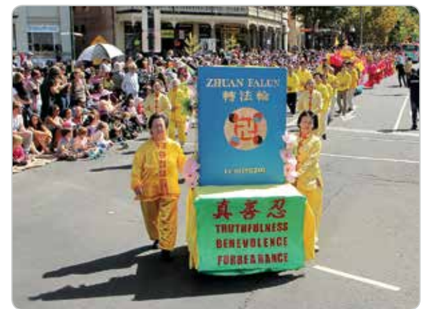
Các học viên Pháp Luân Công tại Úc được mời tham gia nhiều hoạt động quy mô ở các thành phố lớn suốt 22 năm qua. Cuốn "Chuyển Pháp Luân" nhận được sự yêu mến từ người dân thuộc đủ loại sắc tộc.

Nhiều đồng nghiệp của các doanh nhân này đã học tập và noi theo đường lối kinh doanh, cách làm người và con đường đến thành công của họ.