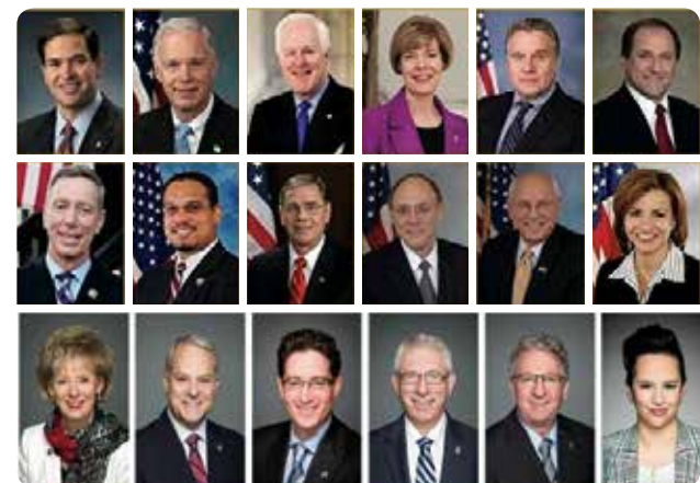
Các nhà lập pháp Hoa Kỳ và Canada lên tiếng ủng hộ Pháp Luân Công đồng thời kêu gọi chấm dứt cuộc bức hại Pháp Luân Công và hồi thúc chính phủ trừng phạt những kẻ phạm tội.

Tháng 7/2022, các học viên Pháp Luân Công ở 38 quốc gia đã tổng hợp và đệ trình danh sách thủ phạm cập nhật lên chính phủ nước sở tại nhằm kêu gọi truy cứu trách nhiệm của những thủ phạm bức hại Pháp Luân Công theo tinh thần của Đạo luật Magnitsky.