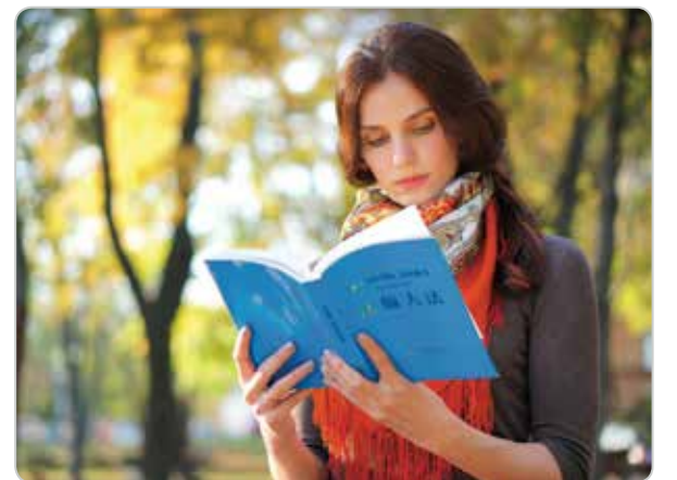
Nhiều người phương Tây từ các dân tộc nói rằng, sau khi đọc sách Chuyển Pháp Luân, họ nhận ra rằng đây chính là Đại Pháp mà họ vẫn luôn tìm kiếm.

Chuyển Pháp Luân hiện đã được dịch ra hơn 40 thứ tiếng và là cuốn sách tiếng Trung được dịch sang nhiều ngôn ngữ nước ngoài nhất cho đến nay.