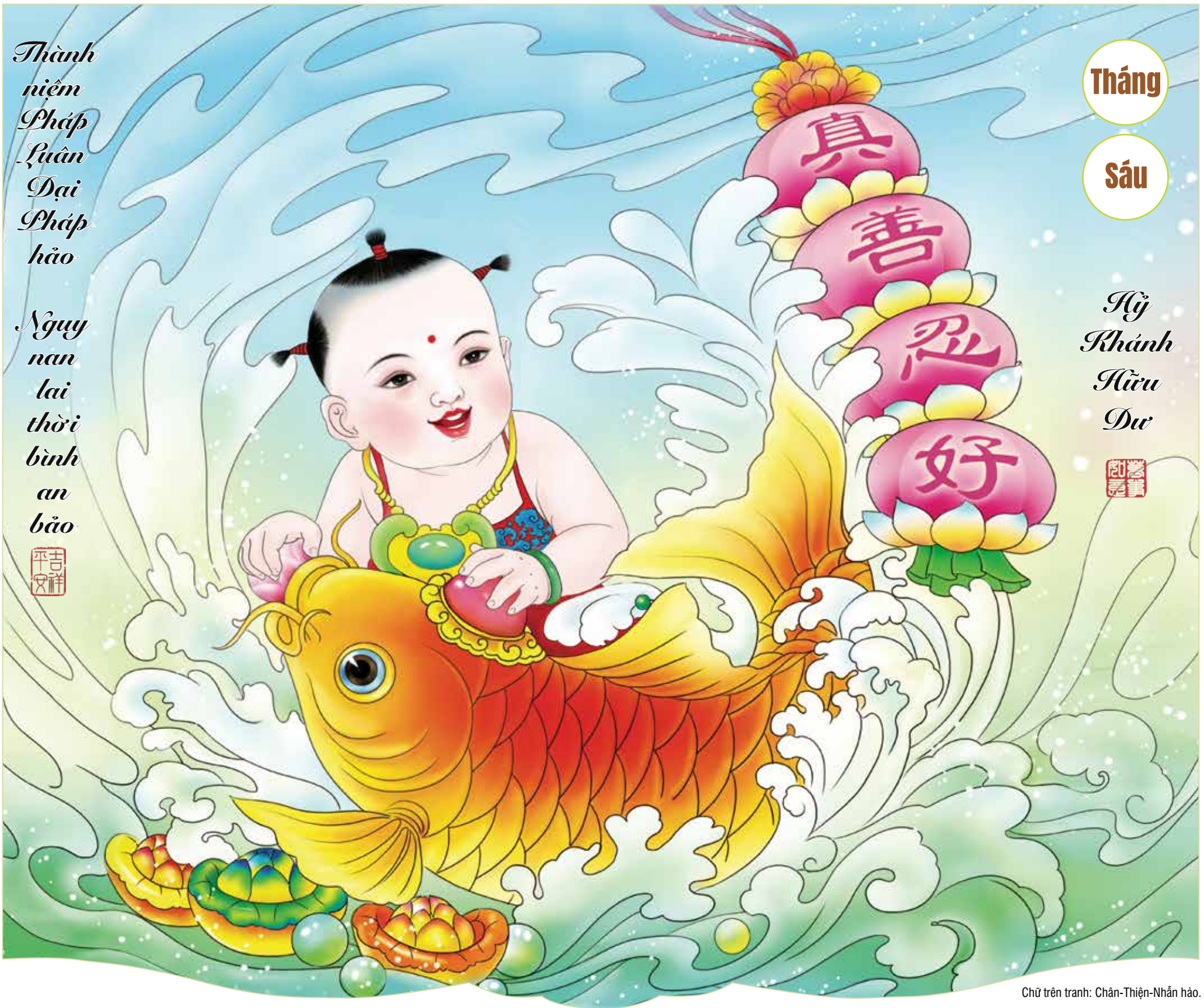
Chữ trên tranh: Chân-Thiện-Nhẫn hảo.