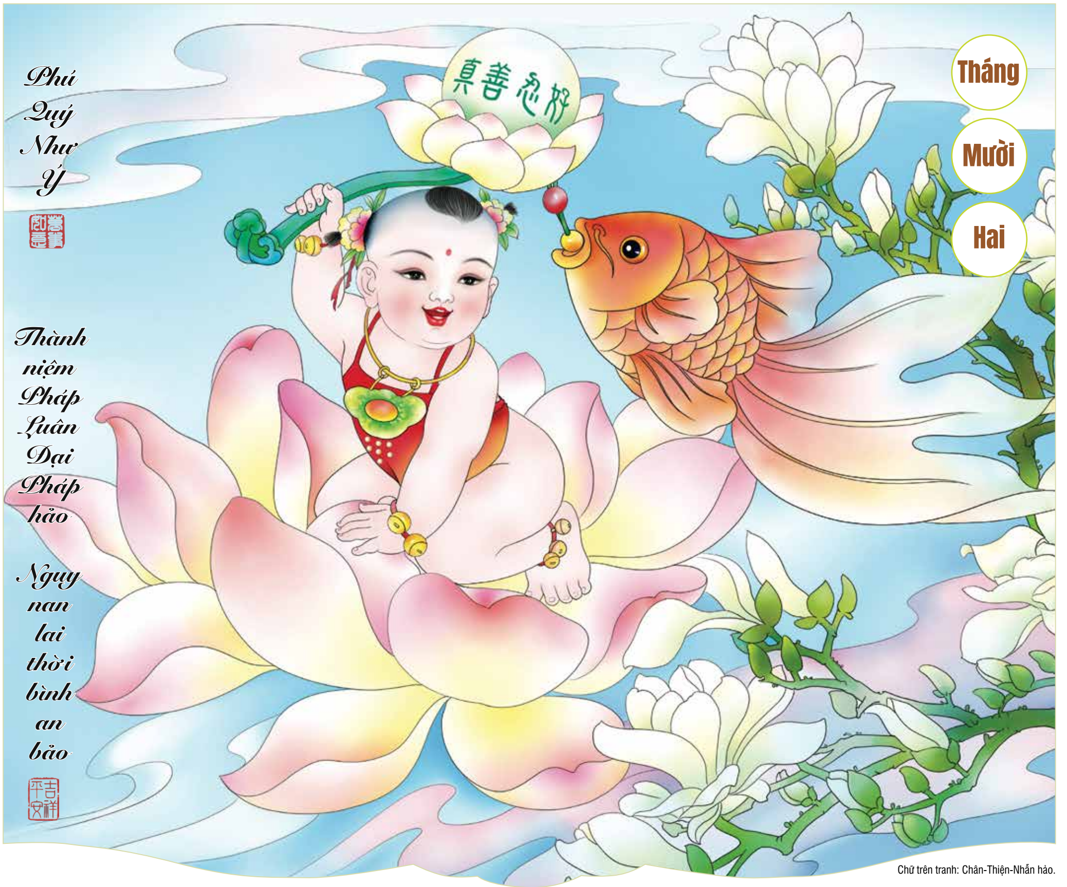
Chữ trên tranh: Chân-Thiện-Nhẫn hảo.