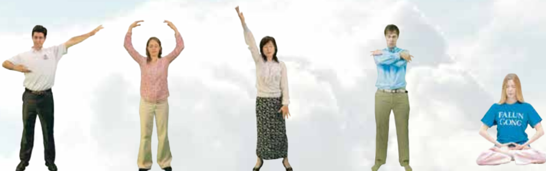
Năm bài công pháp của Pháp Luân Đại Pháp