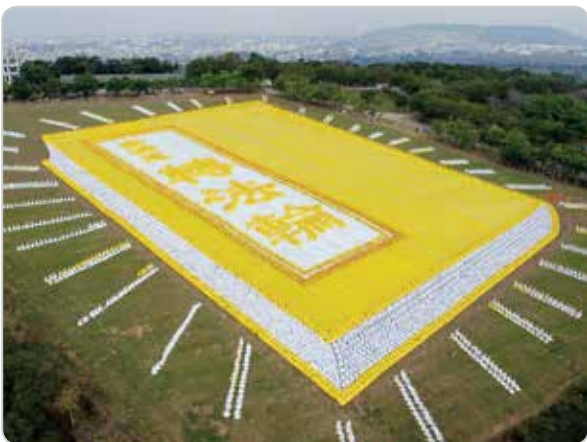
Ngày 21 tháng 11 năm 2009, hơn 6.000 học viên Pháp Luân Công đã tề tựu và xếp hình cuốn sách "Chuyển Pháp Luân" ở Đài Trung, Đài Loan.

Ngày 13/05/1992, Sư phụ Lý Hồng Chí đã truyền Pháp Luân Đại Pháp ra tại Trường Xuân, Trung Quốc. Đến tháng 12/1994, cuốn sách Chuyển Pháp Luân của Sư phụ Lý Hồng Chí được Nhà Xuất bản Phát thanh và Truyền hình Trung Quốc phát hành. Bắc Kinh Nhật báo và các tờ báo khác xếp hạng đây là một trong mười cuốn sách bán chạy nhất.