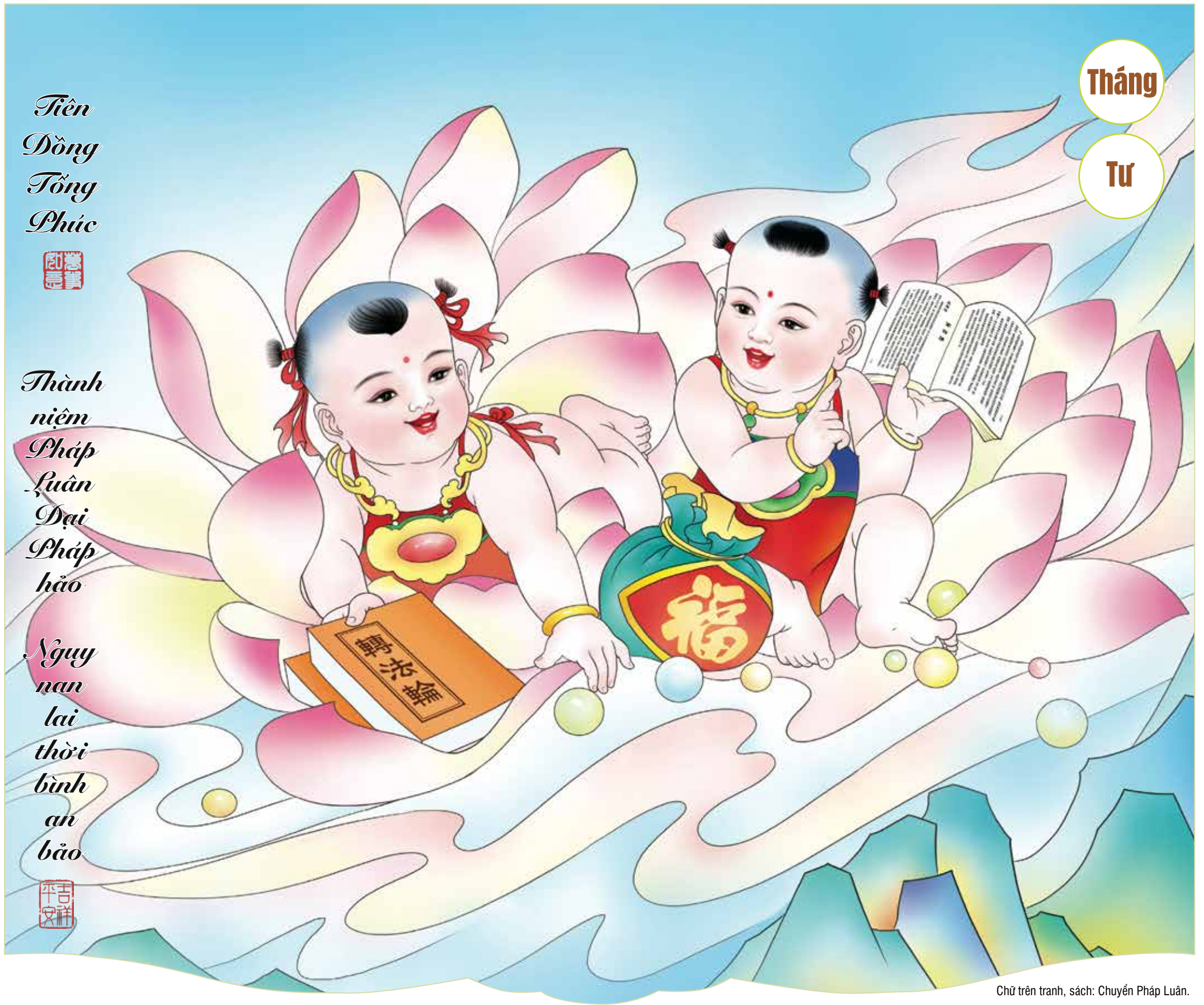
Chữ trên tranh, sách: Chuyển Pháp Luân.